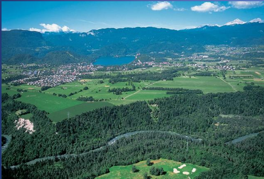
Sonaravni gozdovi (Leopold Hufnagl, 1892)