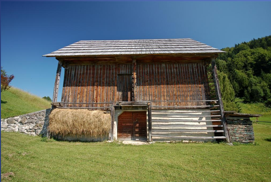
Kulturna krajina Policentrična poselitev