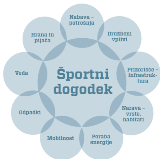
Slika 1: vplivi športnega dogodka na okolje in družbo

Šport je hkrati vzrok in žrtev negativnih človeških vplivov na okolje in družbo. Še posebej pogosto je šport v konfliktu z okoljem: športni dogodki proizvedejo veliko emisij toplogrednih plinov ter kemičnega, svetlobnega in zvočnega onesnaženja, naravo pa brezobzirno izkoristijo. Podnebne spremembe, tanjšanje ozonskega plašča, širjenje puščav, krčenje za stabilnost podnebja ključnih tropskih gozdov, onesnaženost voda ter izčrpavanje naravnih virov so le nekatere izmed posledic našega neodgovornega ravnanja v naravnem okolju. Na vse to šport vpliva in vse to tudi vpliva na šport. Nazoren primer so podnebne spremembe, ki v zadnjih letih v Sloveniji krojijo izvedbo zimskih športnih tekmovanj. Previsoke zimske temperature so vodile v odpoved tekem svetovnega pokala v alpskem smučanju, biatlonu, ipd. Po drugi strani pa prav ti športni dogodki s posegi v naravo tudi negativno prispevajo k takšnemu stanju. Gre za začaran krog, ki ga je treba prekiniti s trajnostnimi praksami. S tem v zvezi imajo športni menedžerji, organizatorji športnih dogodkov, športniki in ostali deležniki v športni industriji veliko odgovornost do našega okolja, saj so športni dogodki čudovita priložnost za vplivanje na veliko število ljudi, ki jih šport neposredno in posredno zadeva.