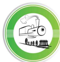
Z VLAKOM V PLANICO

Eden ključnih vplivov prireditve v Planici je mobilnost udeležencev. Največ izpustov toplogrednih plinov v zvezi s športnim dogodkom nastane zaradi prevozov obiskovalcev in športnikov. Glavni cilj je razvoj prometa v smeri zmanjšanja uporabe fosilnih goriv in posledično zmanjšanje onesnaževanja zraka in zmanjševanje vplivov na podnebne spremembe. Potovanje z javnim prevozom veliko pripomore k zmanjševanju izpustov, predstavlja pa tudi cenejši in manj stresen način prevoza, saj ljudje nimajo težav s parkiranjem in čakanjem v koloni. Ena izmed letošnjih aktivnosti je spodbuditi ljudi, naj pridejo z vlakom in avtobusom, ali pa naj si vsaj delijo prevoz. Ponujajo 50-odstotni popust na vožnjo z vlakom do Jesenic in nato brezplačno z avtobusom do Planice. Spodbujajo tudi k deljenju prevoza – odprli so dogodek za skupni prevoz na spletni strani www.prevoz.org .