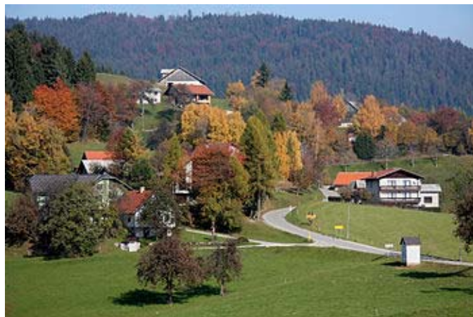
Podeželska krajina, ki jo v Sloveniji pričakujejo obiskovalci – preplet narave in kulturne krajine.

In nenazadnje: različni načini neposredne prodaje in turizem veliko bolj kot drugi prodajni kanali, kot so npr. prehranska industrija in trgovske verige, podeželskim prebivalcem omogočajo višjo stopnjo avtonomije pri določanju cen ter pravičnejše plačilo za njihove proizvode in storitve .